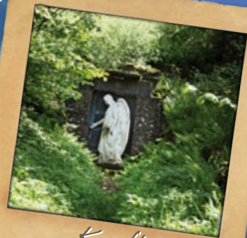
Kruft Weißer Engel

Graf Alexander ließ im Wald „Auf der Burg“ eine Grabstätte für die gesamte gräfliche Familie herrichten. Symbolisch hält vor der Kruft eine Engelsfigur wache. Graf Alexander starb 1940 im Alter von 93 Jahren an einer Lungenentzündung, wurde jedoch nicht in der Kruft sondern in der Abtei Marienstatt beigesetzt.