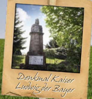
Denkmal Kaiser Ludwig der Bayer