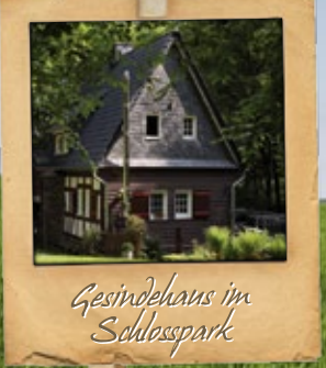
Gesindehaus im Schlosspark