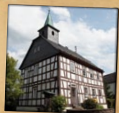
„Alte Schule“ Friedewald

Das Friedewälder „Bäumchen“ stellte 1662 - erstmals urkundlich erwähnt - den Grenzpunkt zwischen den Grafschaften Sayn-Hachenburg und Sayn-Altenkirchen dar.